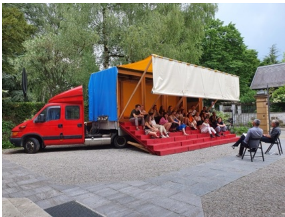
Diskussionen und Vorträge im Mobilien Forum im Aussenraum:«ORAE: Experiences on the Border: The Process», © Foto: ZAZ BELLERIVE