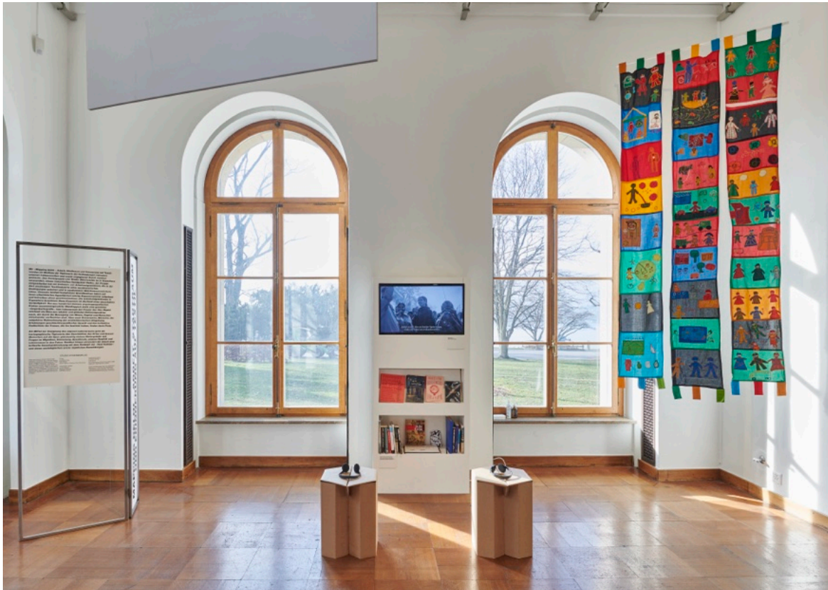
Studio Otherworlds: «Arbeit, Alltag und Erinnerung auf Textil»

Der Anfang des Jahresprogrammes 2022 bildete die Ausstellung «Urbane Räume: 4 Perspektiven» (05.11.2021 – 15.03.2022). Die Ausstellung fokussierte unter anderem auf die aktuelle Stadtentwicklung von Zürich und bot Gelegenheit, ein neues Ausstellungsformat zu lancieren: Nicht nur eine, sondern vier Teilausstellungen zeigten ganz unterschiedliche Zugriffe zum Thema des urbanen Raums und luden die Besucher:innen dazu ein, den Lebensraum Stadt aus unterschiedlichen Warten neu zu erschliessen. Im EG des ZAZ eröffneten die Fotografien der Serie «Suite» von Meret Wandeler einen neuen Blick in die äusseren Quartiere Zürichs. Die renommierte Fotografin richtete darin die Kamera auf die charakteristischen Fensterscheiben dieser Gegenden, in denen sich der Stadtraum spiegelt. «Mapping Delhi: Arbeit, Alltag und Erinnerung auf Textil» präsentierte eine raumfüllende Tapissérie – das Ergebnis eines aktivistischen Kunstprojekts des Studio Otherworlds (Nitin Bathla und Sumedha Garg). Das Werk von Arbeiter:innen der indischen Textilindustrie, welche in dichten Siedlungen an der Peripherie von Delhi leben, warf einen kritischen Blick auf ihren urbanen Lebensbereich. Im OG des ZAZ hinterfragte das Kollektiv 8000 Agency (Oliver Burch, Jakob Junghanss, Lukas Ryffel) in «Siedlung Wydäckerring.