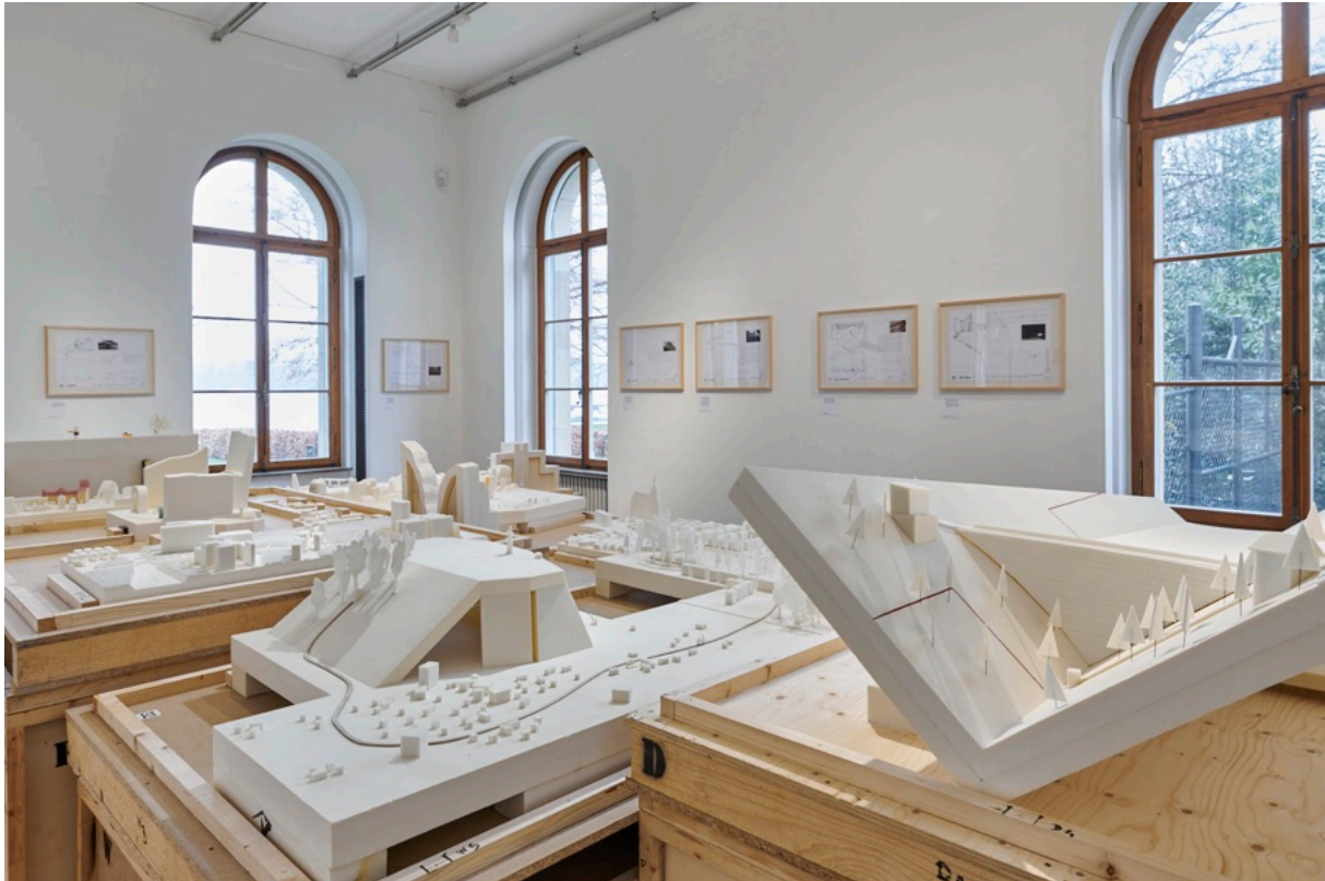
Ausstellungsansicht EG, im EG des ZAZ

Die Vernissage fand unter dem Einfluss der Pandemie mit beschränkter Teilnehmer:innenzahl statt. Total fanden sich sechzig Personen an der Eröffnung ein.