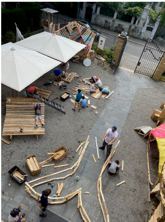
Kinder bauen ihre Wunschstadt: Sommerferien-Workshop 2022 mit Pialeto