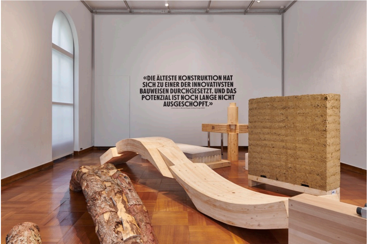
Berühren bitte: Mockups im ZAZ BELLERIVE