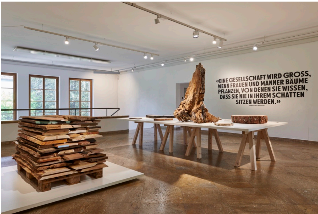
Zeitreise: Über den Baum und vergessene Hölzer, Ausstellungsansicht «Touch Wood», © Foto: Nakarin-Fotografie