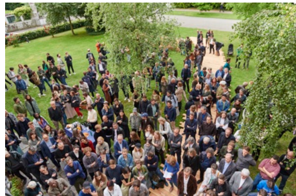
Ausstellungseröffnung «Touch Wood» am 8. Juni 2022, © Foto: Nakarin-Fotografie