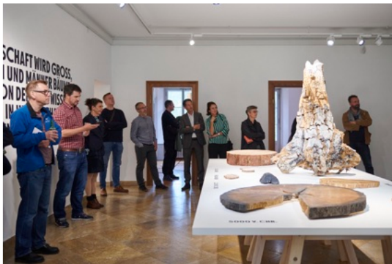
Führung durch die Ausstellung «Touch Wood»