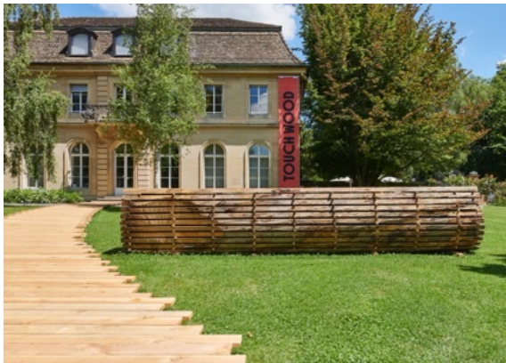
Holzsteg mit Installation, Aussenansicht 2022, © Foto: Nakarin-Fotografie