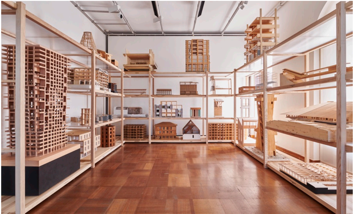
Modelle aktueller Holzarchitektur, Ausstellungsansicht «Touch Wood» im EG

10. Juni 2022 bis 30. Oktober 2022, Verlängerung bis 18. Dezember 2022