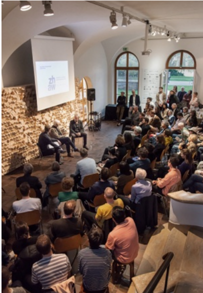
Veranstaltung «Lasst uns über die 'Natur' sprechen»