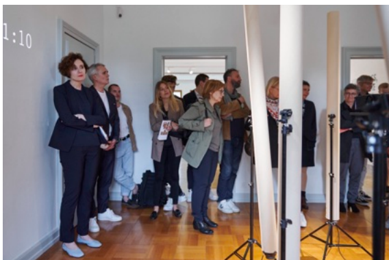
Bäume wachsen hören: Akustische Installation «Growth Model» von Marcus Maeder, Führung «Touch Wood»