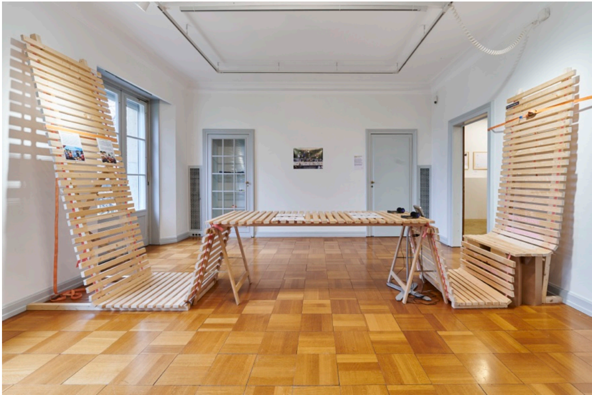
Architecture for Refugees: «The Sustainable City is an Inclusive City, Ausstellungsansicht «ORAE» im ZAZ BELLERIVE