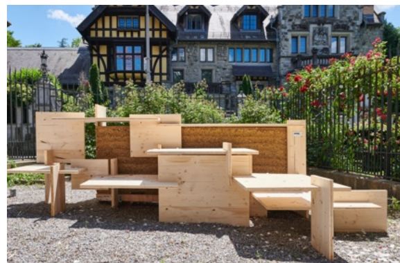
Lehm- und Holzkonstruktionen: Mockups zum Anfassen im Aussenraum