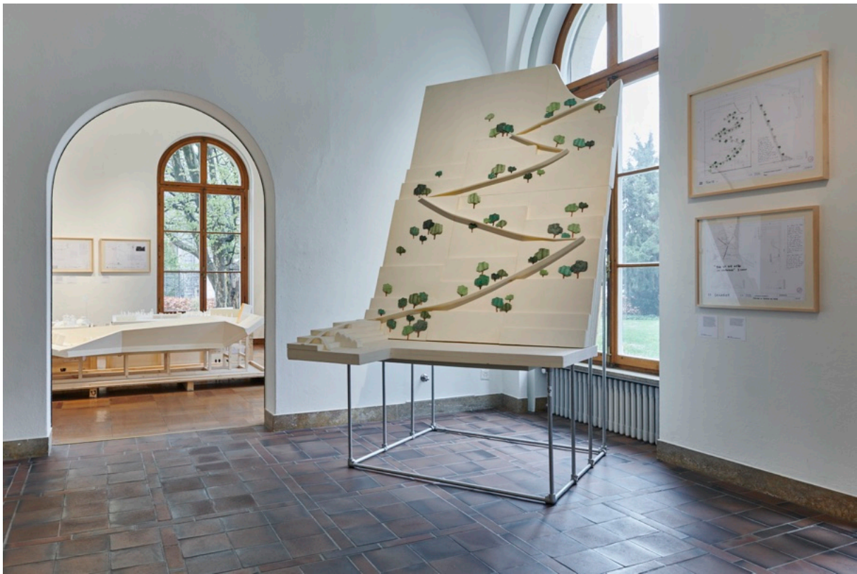
Ausstellungsansicht Foyer EG im ZAZ