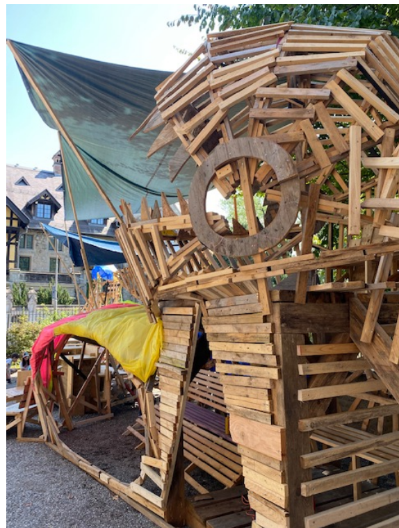
Begehbare Holzinstallationen, Ferienworkshop, © Foto: ZAZ BELLERIVE