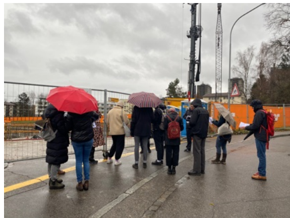
Bei Wind und jedem Wetter: Führung extra muros, Tour «Ersatz Neu Bau Boom» in Kooperation mit dem Kollektiv 8000.agency am Wydäckerring, © Foto: ZAZ BELLERIVE